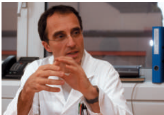
«Vorfinanzierung und Beteiligungen gehören bei uns zum Alltag.»