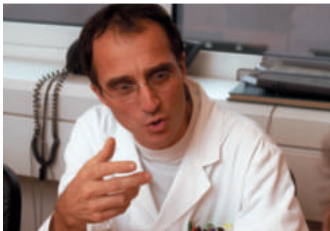
«Bis ins Jahr 2015 werden 50% der weltweit gehandelten Speisefische und Meeresfrüchte aus der Zucht kommen.»