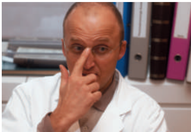
«Wir möchten in der Gastro-Champions League mitspielen.»

zu werden – ja wir sind eben auch ein Logistikunternehmen.